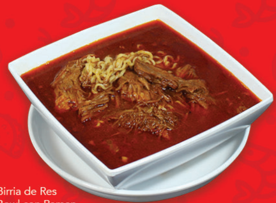
Birria de Res Bowl con Ramen