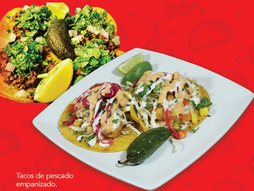
Tacos de pescado empanizado.