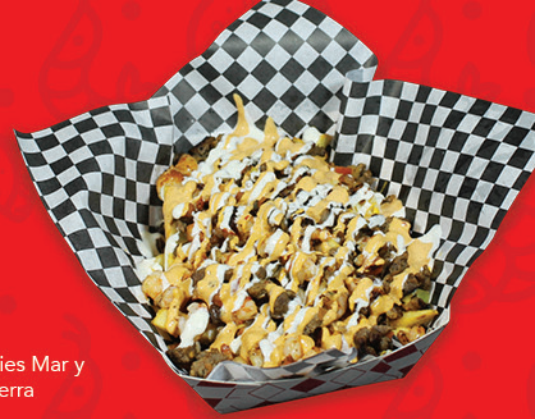
Fries Mar y Tierra