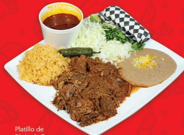
Platillo de Birria de Res